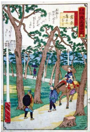
富士山の玉手箱 特集展示から 三代歌川広重 東海名所改正道中記 十七 左り不二 吉原蒲原迄一り三十丁