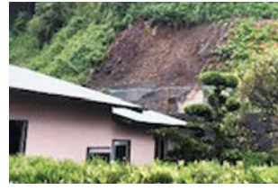
▲台風の被害 (令和4年9月 中之郷)

避難情報や気象情報を「警戒レベル」として5段階に分けています。危険区域に住んでいる人などが取るべき行動を、段階に応じて示しています(下表参照)。