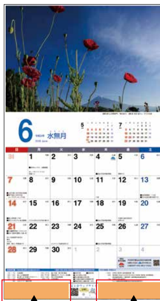
↑ 広告掲載場所 ↑