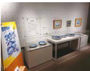
富士山の玉手箱 展示の様子