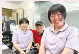
▲合同会社 季望の芽

昨年5月に起業し、金融機関からの融資も決定しました。起業後も、人事労務や財務に関する経営課題を支援してもらい、新しいサービスの提供を始めました。