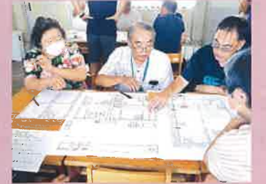
ひなんじょたいけんのグループワーク

静岡県支部では、地域の防災力向上を支援するため、防災や減災に関する知識や技術を学べる「赤十字防災セミナー」を自治会等を中心に県内各地で開催します。