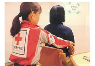
リラクゼーションを行うこころのケア要員

これらの活動は、皆様からのご支援により続けることができます。引き続き、赤十字活動資金にご協力をお願いいたします。