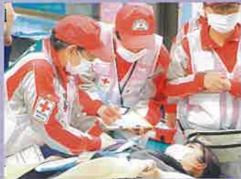
仮想傷病者の状態を確認する救護班