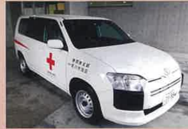
災害救護用自動車

また、市町への支援として発災時に避難所の状況確認やニーズを調整する職員派遣のための災害救護用自動車や、被災者へ迅速に救援物資をお届けするための救護用倉庫を更新します。