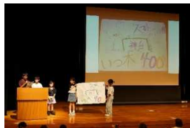
【ビジネスプラン発表会】

小中学生を対象に、ビジネスに限らない広い知識、スキル、態度や姿勢を身につけるため、アントレプレナーシップ教育を実施する。チームでビジネスプランを考え、ものづくり交流フェアのステージで、出展企業や来場者に向けたプレゼン発表を行う。