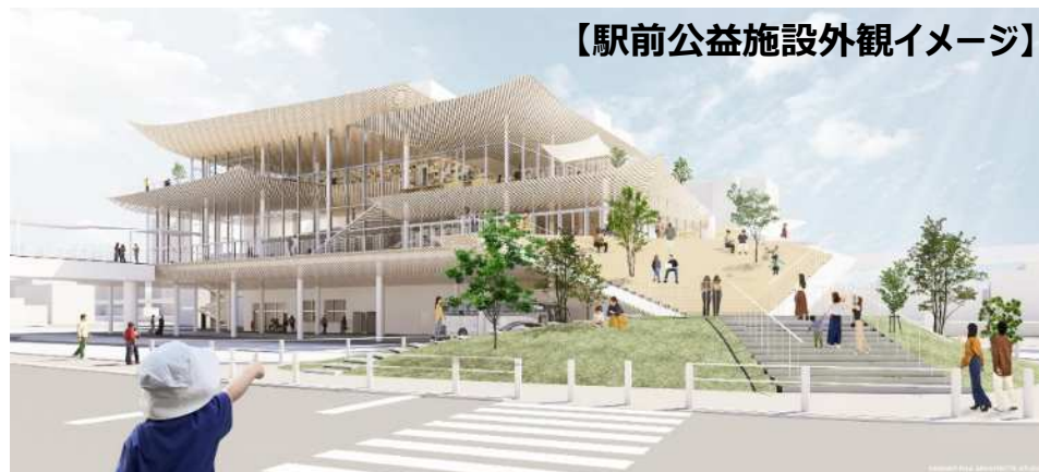
【駅前公益施設外観イメージ】

駅前広場内にある既存施設の移設関連費用、ペDESTリアンデッキや駅前広場の詳細設計を実施する。