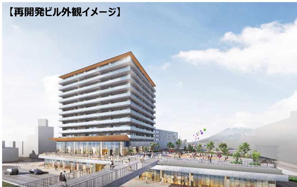
【再開発ビル外観イメージ】