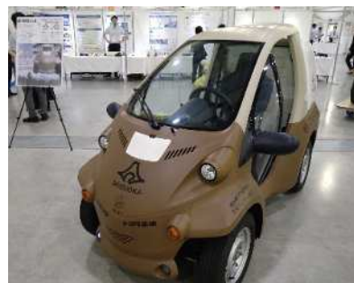
【静岡県産木材等を活用した コンセプトカー「しずおか もくまる」】