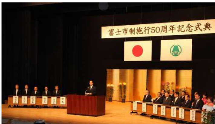
【市制60周年記念式典】