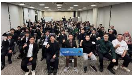
【ミートアップイベント】

地域課題解決を目指す市内外スタートアップや、新事業展開などさらなる成長を目指す市内スタートアップに対して、ビジネスアイデアのブラッシュアップから資金調達等までの総合的な伴走支援を実施する。