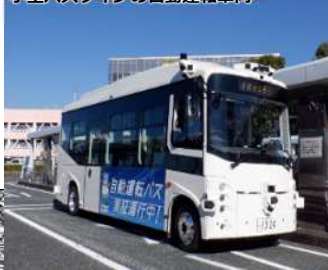
小型バスタイプの自動運転車両

令和7年度に実施した実証運行や調査事業の結果等を踏まえ、信号連携を実施するなど高度化した実証運行や観光拠点を結ぶルートの検証を行うとともに、社会実装に向けた協議体を設置する。