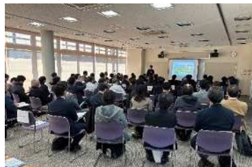
【事業プラン発表会】