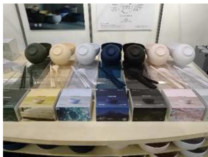
【富士市CNFブランド認定製品 Mawal（エフピー化成工業）】

静岡県と共催のCNF等セルロース素材に特化した国内最大規模の展示会を開催する。デジタルツールを活用した広報や大学等研究者の出展支援により、大学と出展者・来場者とのマッチング促進を図る。