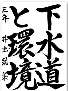
中学生の部 岳陽中学校 3年