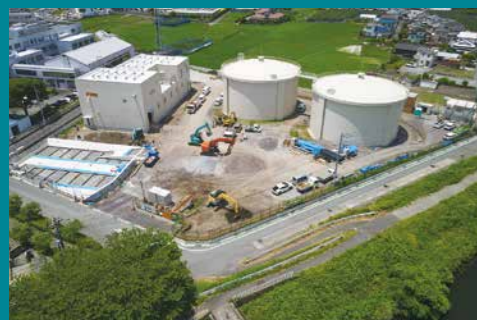
富士中央配水池（令和8年4月供用予定）