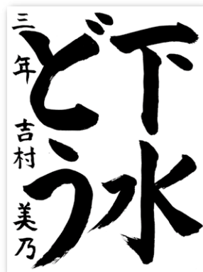
小学校 低学年の部 吉永第一小学校 3年