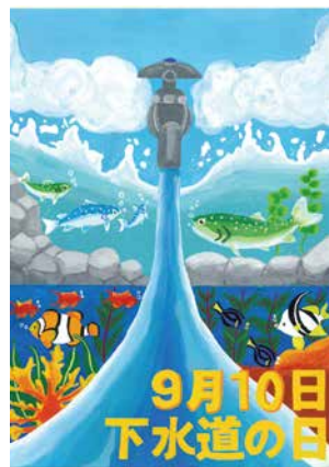
中学生の部 田子浦中学校 2年