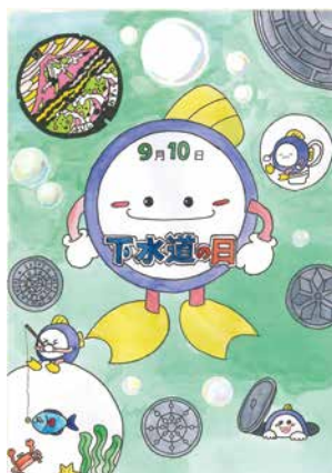
小学校 高学年の部 富士中央小学校 6年