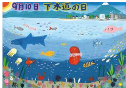
小学校 低学年の部 田子浦小学校 3年