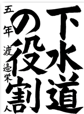
小学校 高学年の部 富士第一小学校 5年