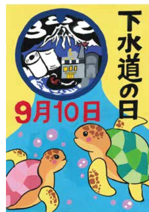
中学生の部 吉原第一中学校 1年