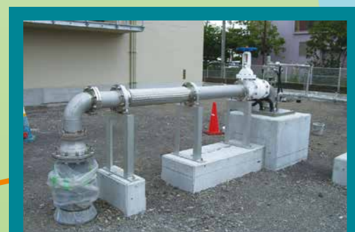
富士北水源地（令和8年4月供用予定）