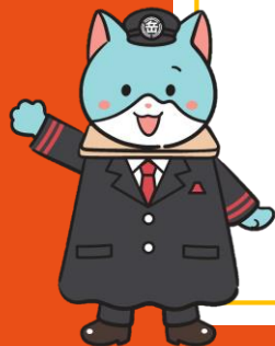
シティプロモーション大使 さもにゃん