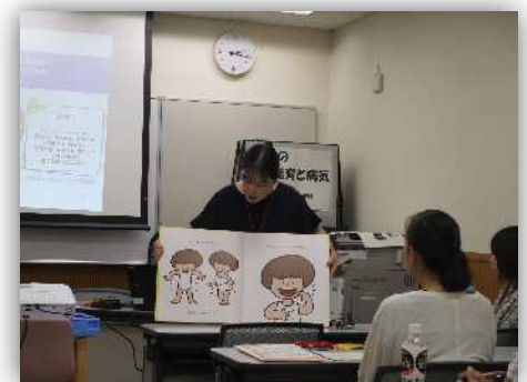
☆身体の発育と病気