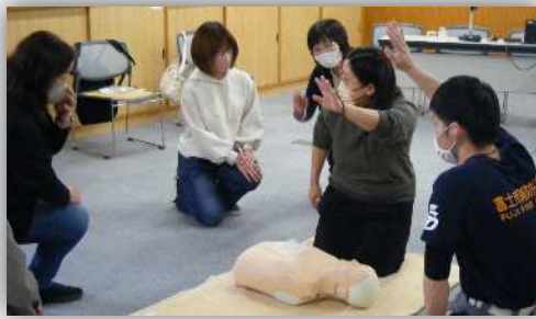
☆こどもの安全と事故