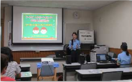
交通安全講習会 R7年9月11日 交通ルールや危険な場面を改めて振り返りました。