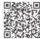
医療情報ネット (ナビイ)