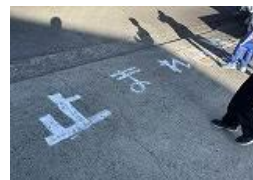
6.7組が「止まれ」の表示を書いてくれました

朝、夕の車での送迎時に、運転が危険な車がいっぱい怖いとの御意見が寄せられています。保護者の皆様には、校内では安全を最優先し、送迎ルールの厳守、最徐行、生徒並びに歩行者優先を徹底するようお願いいたします。また、送迎の車が校内から校外に突然飛び出して危険だと声も寄せられています。公道に出る時には一旦停止、左右確認をお願い致します。