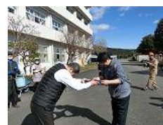
多数回、参加をしていただいた方に感謝状を贈呈しました

2月26日（木）午後1時より今年度最後の校内整備校内環境ボランティアを実施しました。保護者、地域の皆様、するが荘の皆様など、1年間、御協力ありがとうございました。おかげさまできれいな校内環境を保つことができました。来年度もよろしくお願ひします。