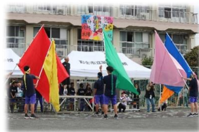
「協調の翼」と色別縦割り集団の6つの色別応援旗

10月14日（火）からは、後期生徒会の活動がスタートしました。生徒会活動は、自分たちの学校をよりよくするために、生徒が自ら考え、自ら行動する活動です。教職員も支援役となり、生徒が一人一人が岩松中のよき伝統を引き継いでいってくれることを期待しています。