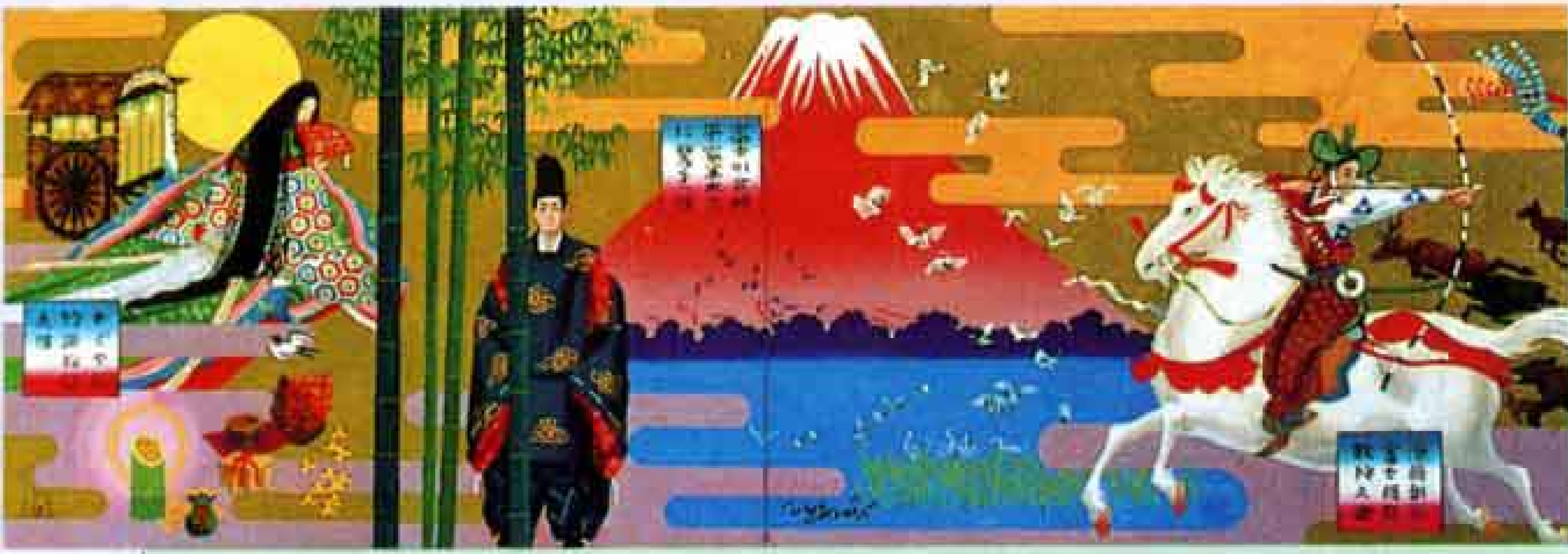
△まき絵風の壁画の原画