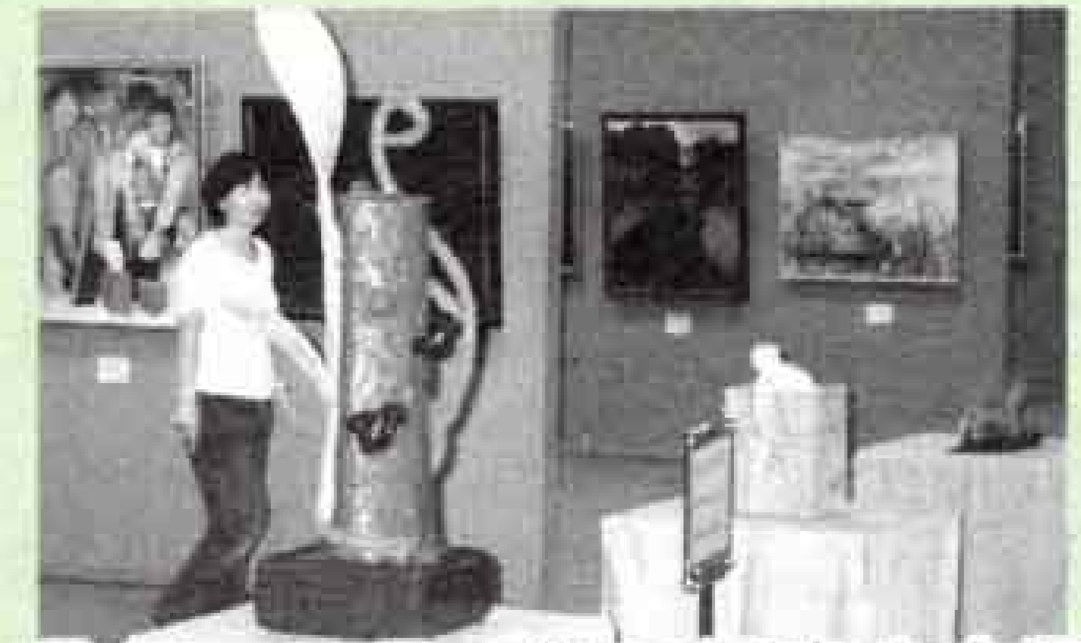
6月17～20日 第33回富士市展 第1期 絵画・彫刻展