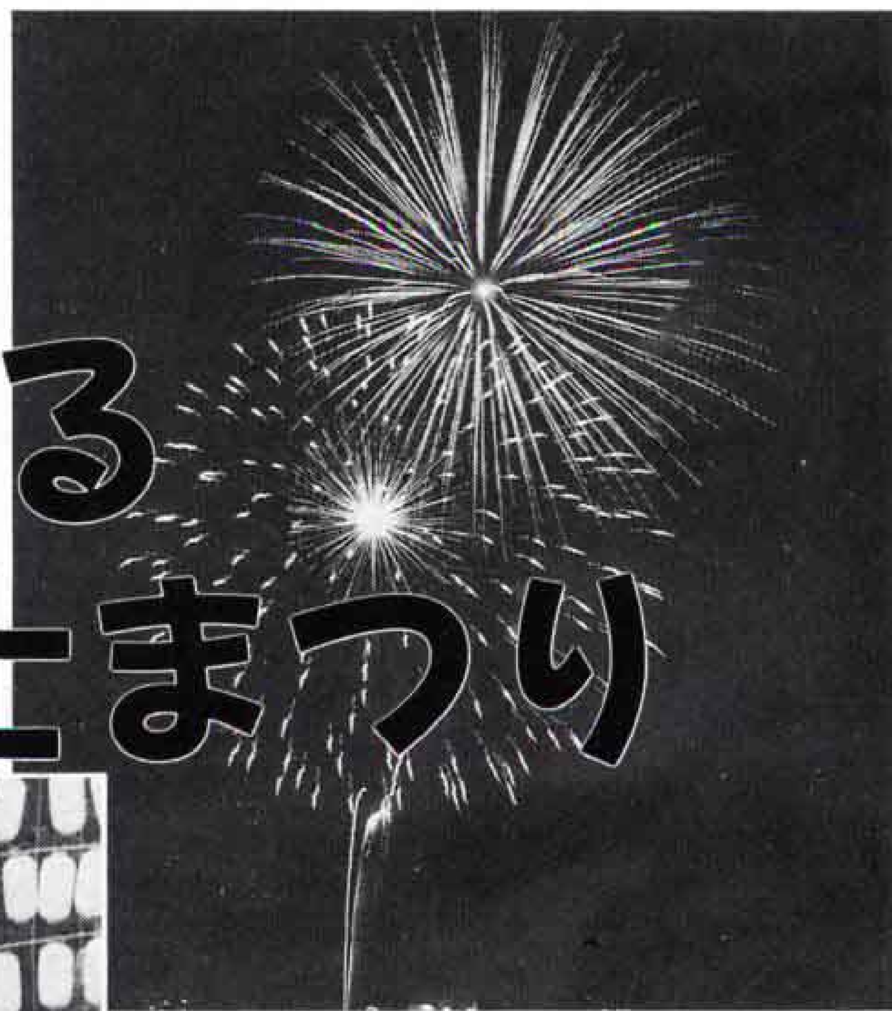
△夜空を彩った花火