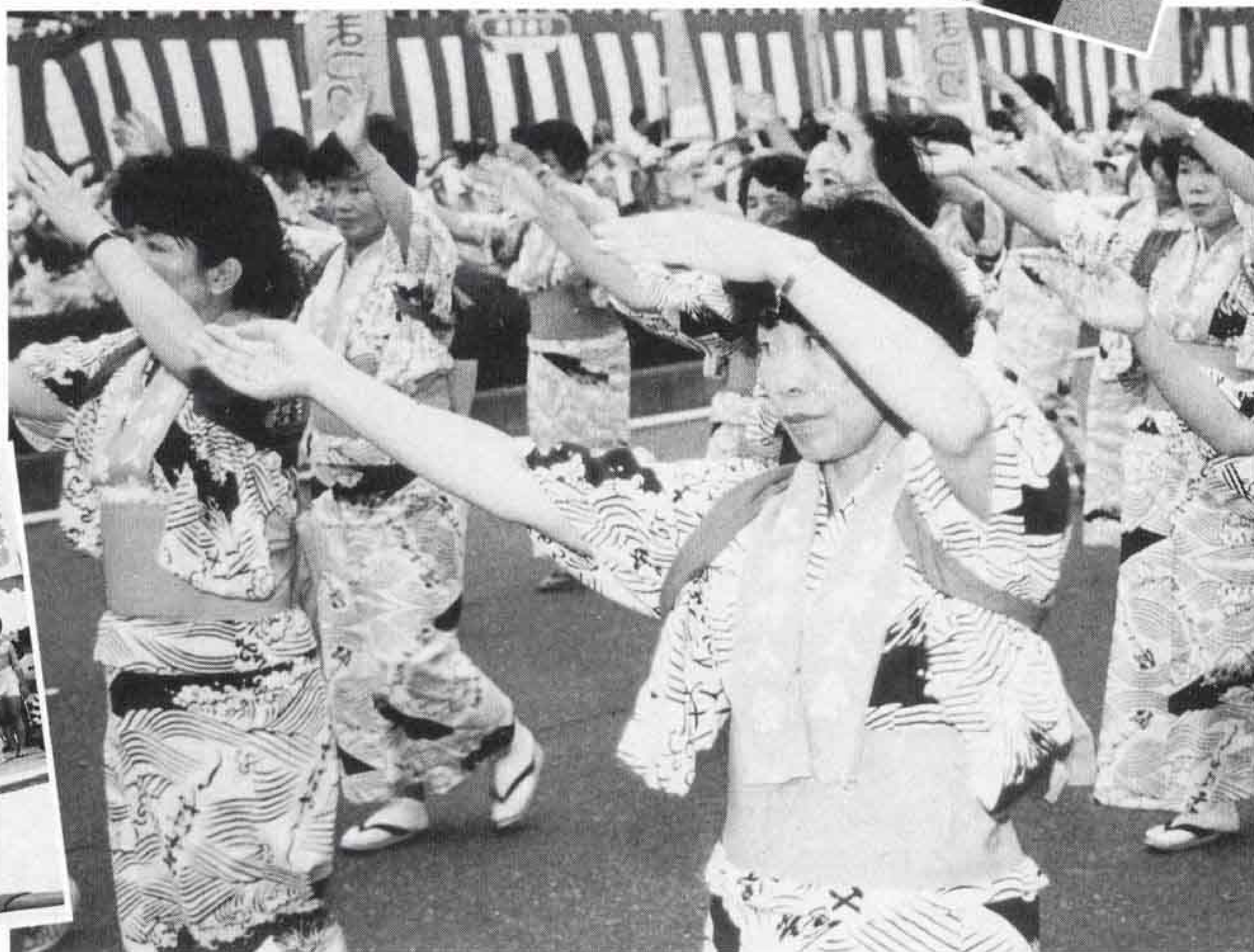
△市民総おどりは、毎年参加者がふえています

七月二十八・二十九日に、市役所周辺で富士まつりが行われ、五万人の人でにぎわいました。二十六団体、三千四百人が参加した市民総おどりと子供みこしが通りを練り歩き、ステージでは、太鼓の競演に大きな拍手も沸きました。五千発の花火が祭りを締めくくりましたが、ふるさとの思い出として、心の中に残ります。