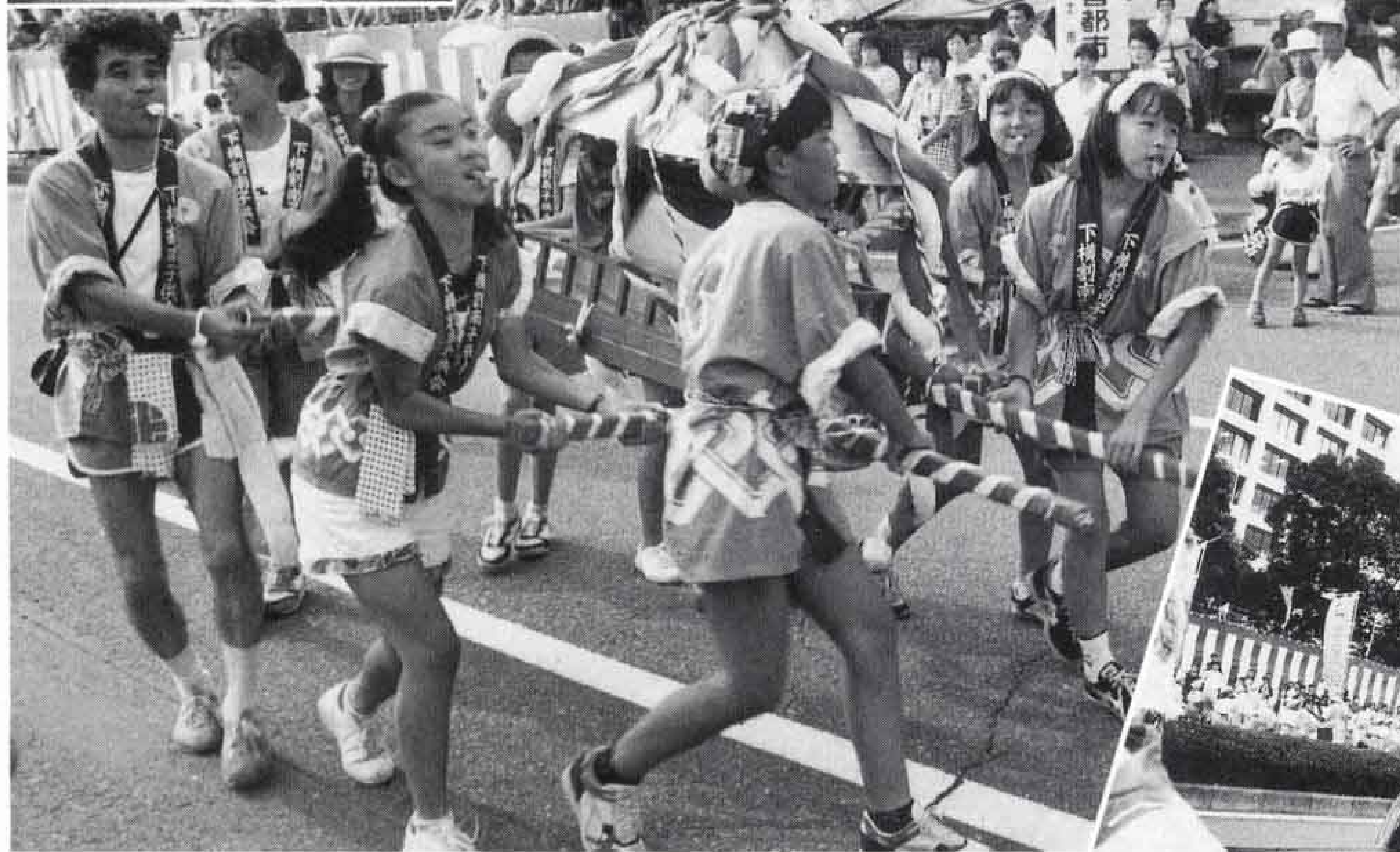
△こどもみこしだワッショイ、ワッショイ!