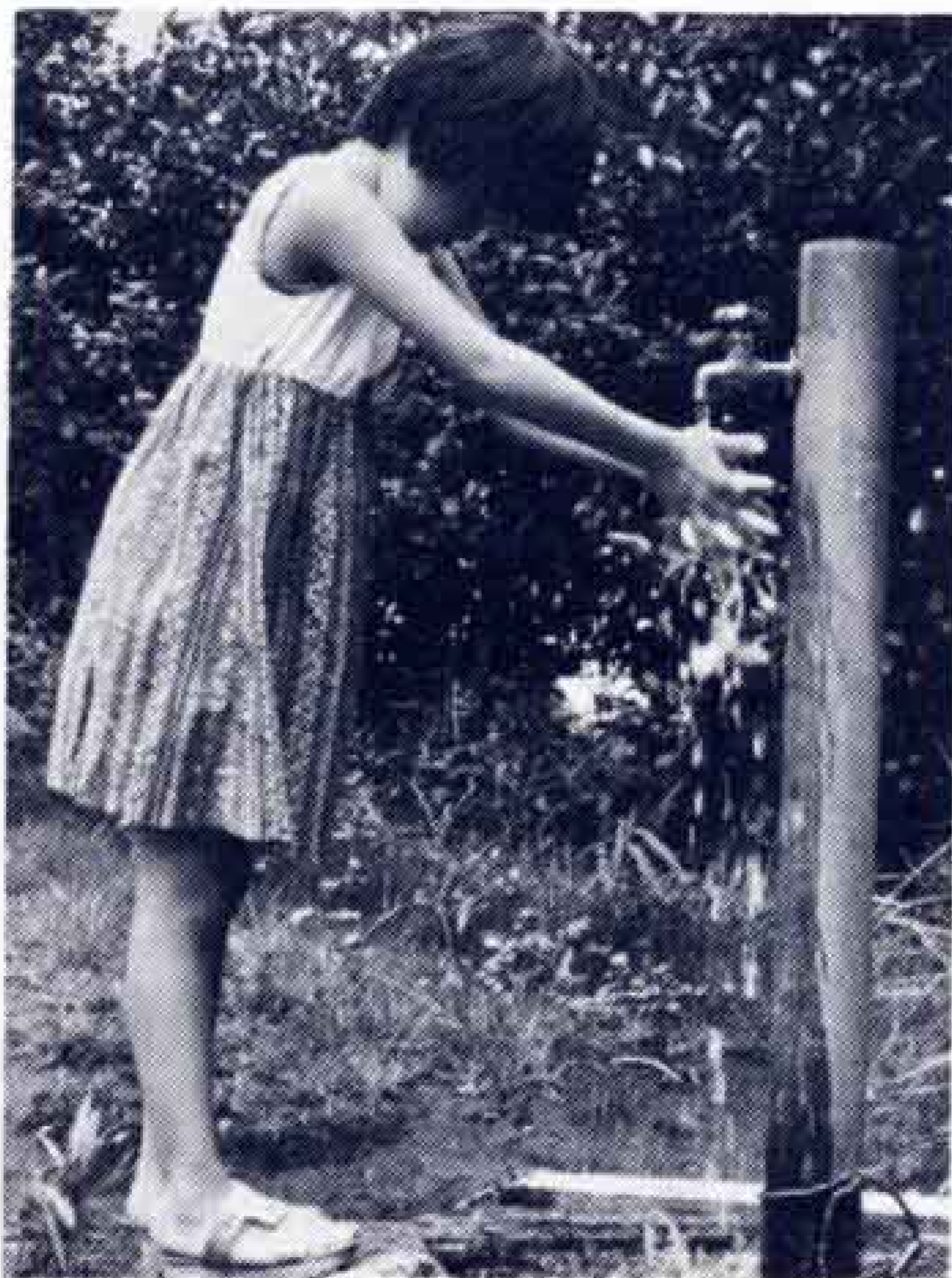
岩本山公園の水のみ場