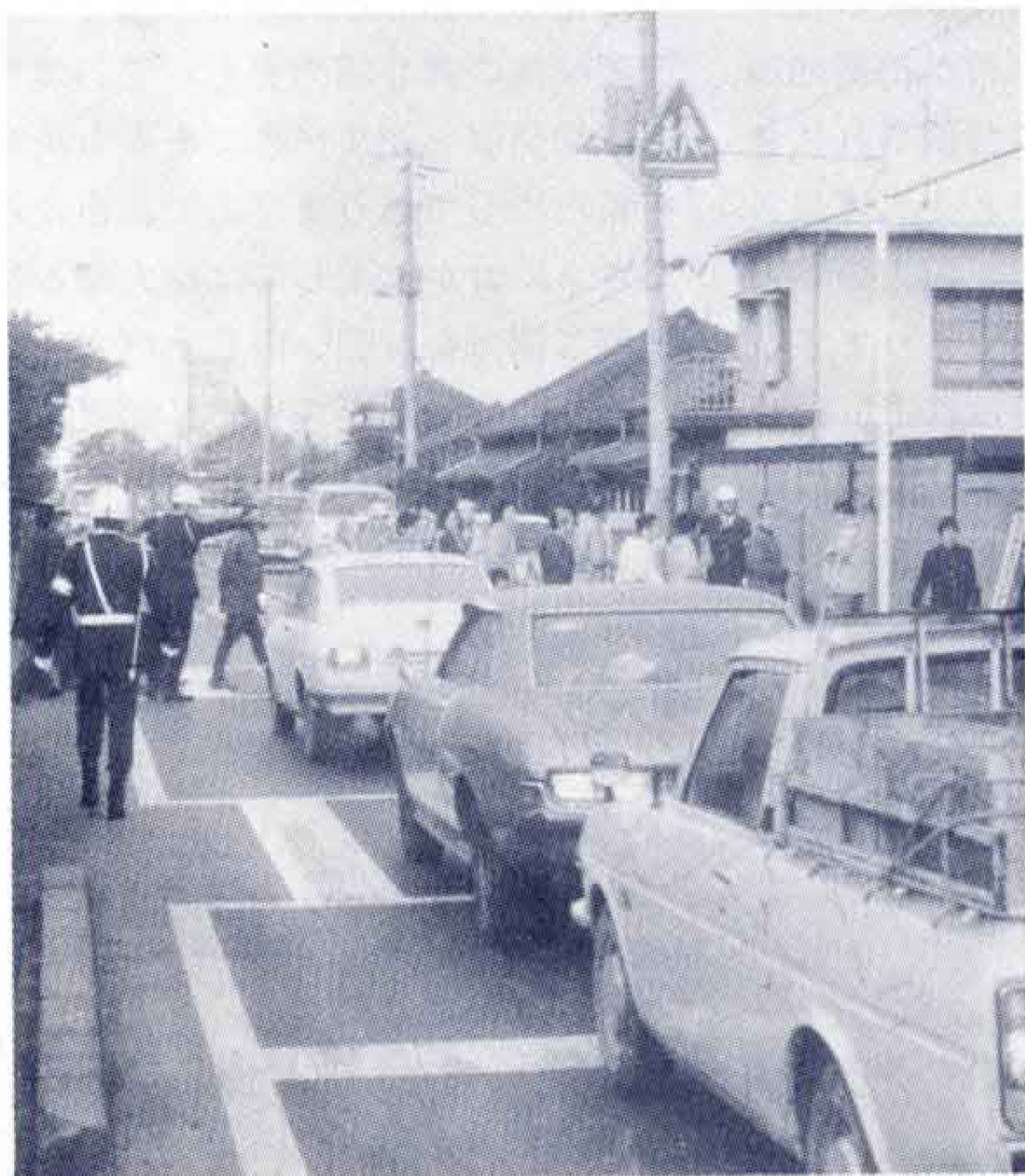
【牛歩作戦で国一バイパスの早期建設を訴える】

ば、夜間とか日曜日専門に見てくれる病院があつてもいいと思います。人間いつ病気やケガをするかわかりませんから、夜間や休日の医療体制の充実をはかつてください。