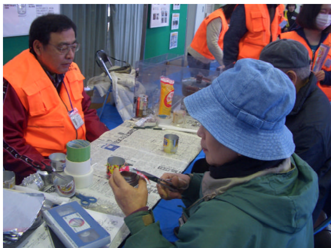
アルミ缶コンロ作成体験