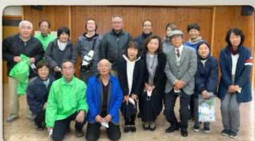
【中部ブロックの皆さんお疲れ様でした】