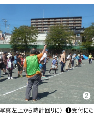
(写真左上から時計回りに) ①受付にたくさんの方が集まった ②パンを目指して「よいどん!」 ③なつかしの遊びコーナーの竹馬

9/24(日) 広見スポーツフェスティバル 9月24日(日)、広見地区体育館において、広見地区スポーツフェスティバルを開催しました。約200名が参加し、様々な競技を行いました。また、おじさん鉄道クラブの鉄道模型展示も行いました。