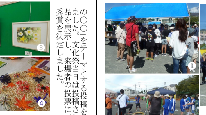
(写真左上から時計回りに) ①受付にたくさんの方が集まった ②パンを目指して「よいどん!」 ③なつかしの遊びコーナーの竹馬

10/22(日) 広見地区文化祭 おまち10月22日(日)、広見地区文化祭を開催しました。約400名が参加し、お楽しみ会やゲームコーナー、おじさん鉄道クラブの鉄道模型展示など、様々な催しを行いました。また、おじさん鉄道クラブの鉄道模型展示も行いました。