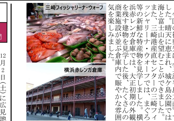
三崎フィッシャリーナ・ウォーフ 横浜赤レンガ倉庫

12/2(土) 広見地区ふれあい訪問 12月2日(土)に広見地区を訪問しました。地域の様子を確認し、今後の活動について話し合いました。また、おじさん鉄道クラブの鉄道模型展示も行いました。