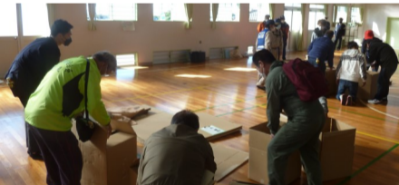
R4年度地区防災会議の様子(簡易ベッド組立講習)