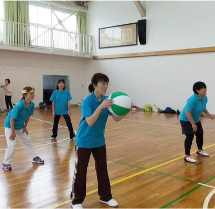
笑顔いっぱいゲーム対戦

福祉推進会では、6月11日(日)広見小学校体育館にて、健康福祉講座「ビーチボールバレー体験会」を実施しました。福祉推進会会員や、広見子どもクラブ、サロンの皆さん等、下は幼稚園年長児から、上は80代の方まで幅広い年代の方々70名程が参加しました。 準備体操後、簡単なルール説明をし、3コートに分かれて1チーム4名12チームで練習や、ゲーム対戦をして、楽しみながら親睦を深めました。ゲームに参加しない応援者は審判を体験し、各コートで笑顔溢れる健康的な半日を過ごしました。