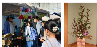
R4年度広見地区文化祭の様子