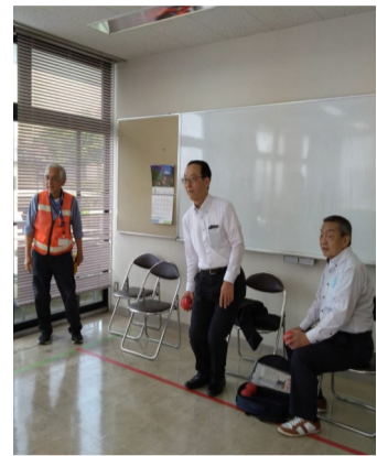
小長井市長もポッチャを体験!

フェスティバルでは、点字体験やミシン体験、輪投げ、ポッチャ体験、触感体験、要約筆記などの各種体験やアイコンビーズ体験など、様々な体験コーナーが設置されました。