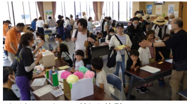
たくさんの人でにぎわう体験コーナー

5月28日(日)広見まちづくりセンターにて「第14回広見福祉フェスティバル」を開催しました。4年ぶりの開催ということもあり、当日の来場者は約千人にのぼりました。 広見福祉フェスティバルは、※ノーマライゼーションの理念のもと、広見地区に住むあらゆる年齢の皆様が、福祉体験等を通し、ふれあいと交流の輪を広げることが目的に実施しています。