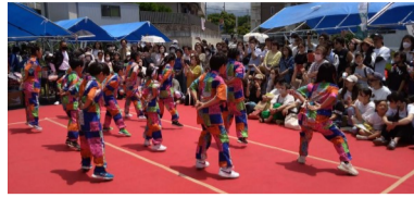
JIGGY DANCE STUDIOのダンス

フェスティバルでは、点字体験やミシン体験、輪投げ、ポッチャ体験、触感体験、要約筆記などの各種体験やアイコンビーズ体験など、様々な体験コーナーが設置されました。