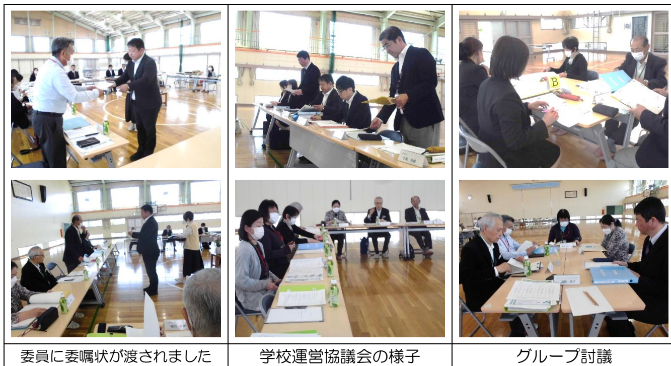
委員に委嘱状が渡されました