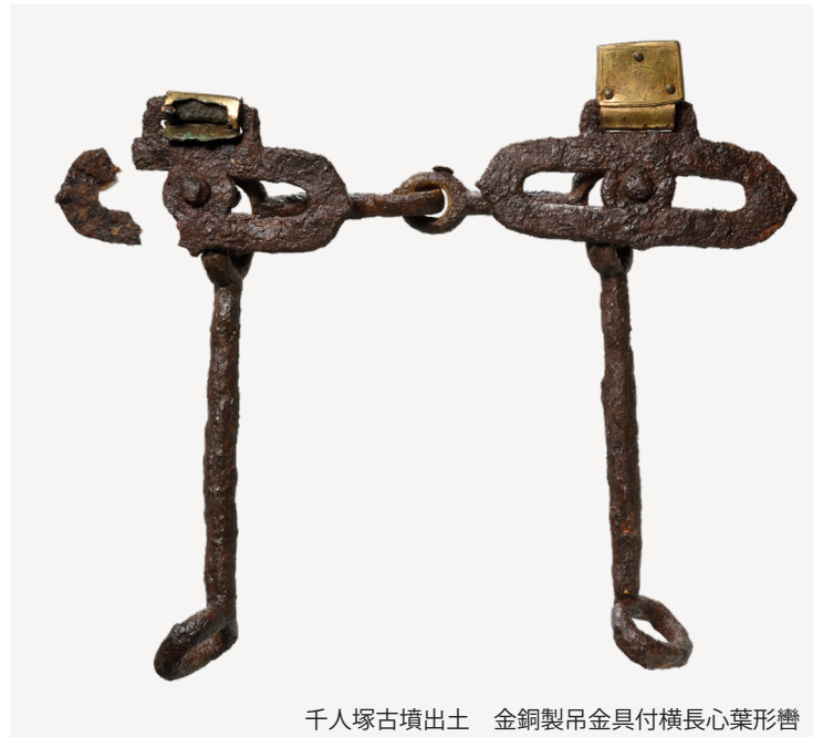
千人塚古墳出土 金銅製吊金具付横長心葉形轡