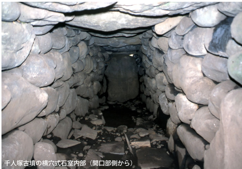
千人塚古墳の横穴式石室内部(開口部側から)

富士市教育委員会 文化財課 富士市埋蔵文化財調査室 TEL 0545-22-2095 MAIL 同上