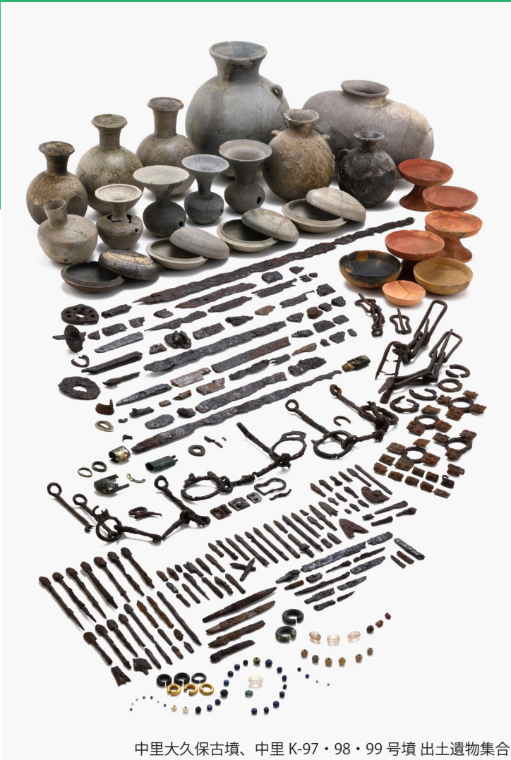
中里大久保古墳、中里 K-97・98・99 号墳 出土遺物集合