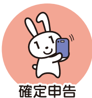
確定申告 (2024年度より)