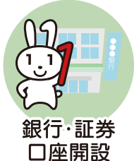
銀行・証券 口座開設