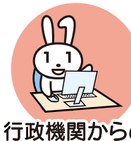
行政機関からの お知らせ・各種証明書