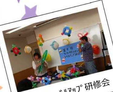
2007年ハルアップ研修会