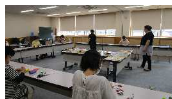
2021年ハルアップ研修会