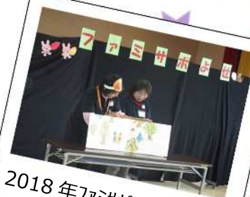
2018年ファミサポまつり